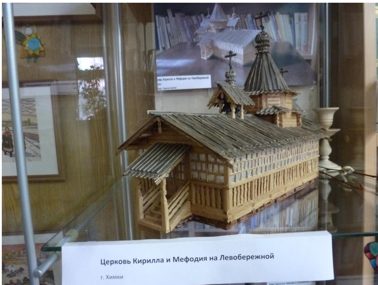
Церковь Кирилла и Мефодия на Левобережной