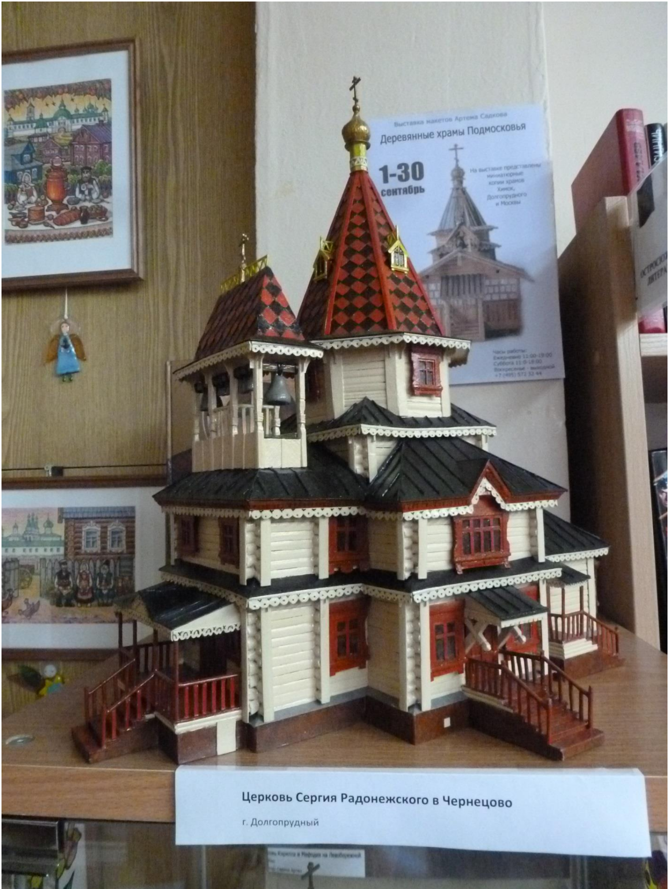
Церковь Сергия Радонежского в Чернецово