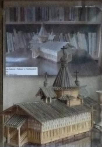
Церковь Варлаама и Мефодия на Лазаревском Татьяна...