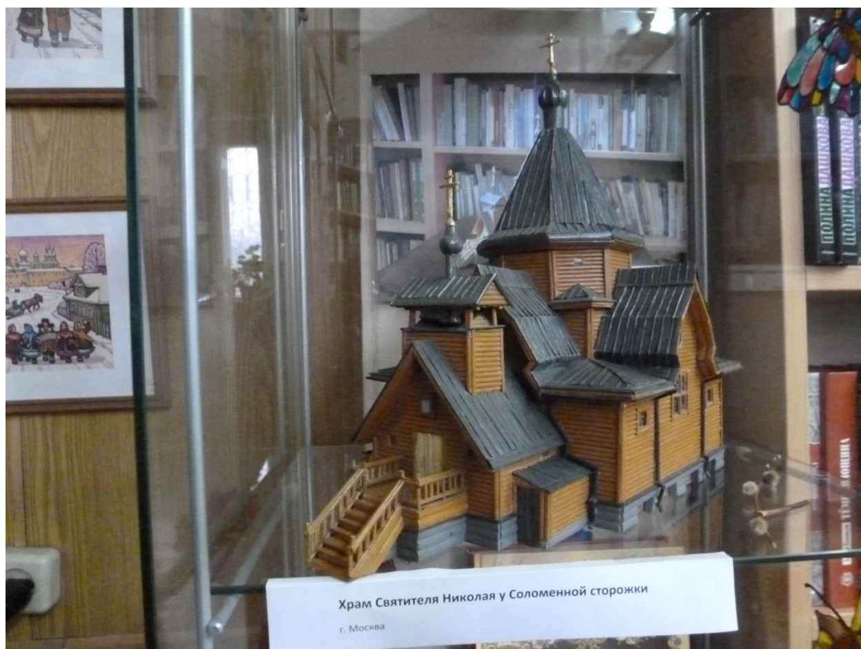
Храм Святителя Николая у Соломённой сторожки