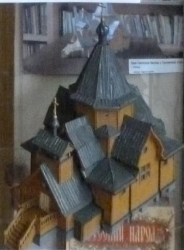
Храм Святых Антония и Симонова Угличских Александр...